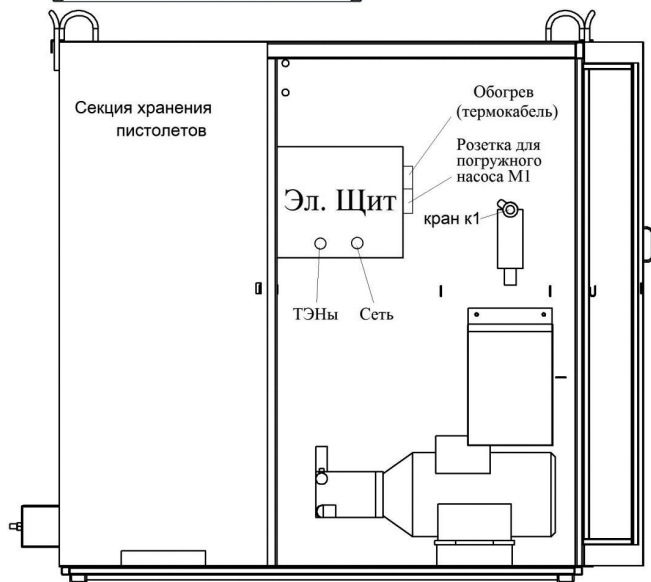
Схема расположения пункта мойки колёс